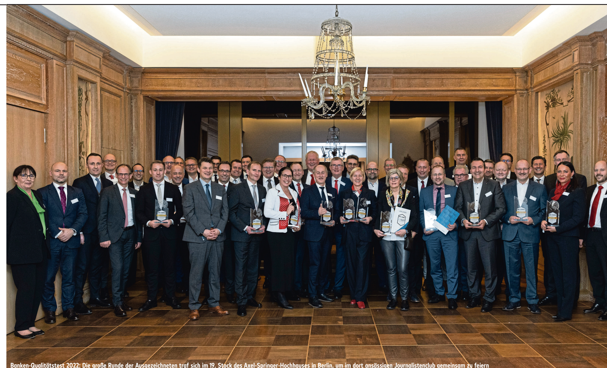
Banken-Qualitätstest 2022: Die große Runde der Ausgezeichneten traf sich im 19. Stock des Axel-Springer-Hochhauses in Berlin, um im dort ansässigen Journalistenclub gemeinsam zu feiern